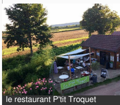
le restaurant P'tit Troquet

15, voûte du canal de Bourgogne 21320 POUILLY-EN- AUXOIS Tél : 03 80 90 71 89 camping-vert-auxois.fr