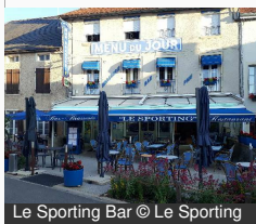
Le Sporting Bar

26 Rue René Laforge 21320 POUILLY-EN- AUXOIS Tél : 03 80 90 70 75 Tél : 06 70 73 19 03