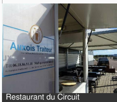
Restaurant du Circuit

Complexe automobile 21320 MEILLY-SUR- ROUVRES Tél : 06 18 86 91 18